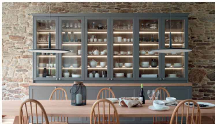
Nova col·lecció 2019

☎ T 93 790 23 08 T 607 44 46 50 Prat de la Riba 66 - Mataró • ruiz.juli@hotmail.com